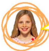
photo - agenda - Moi - six - Il y a - filles - téléphone - s'appellent - sont - copains

Dans mon agenda, il y a une photo de mes copains. Nous sommes six. Les garçons s'appellent Baptiste et Xavier et les filles : Nathalie, Julie et Amandine. Moi, c'est Chloé! Il y a d'autres photos de mes copains dans mon téléphone : elles sont super!